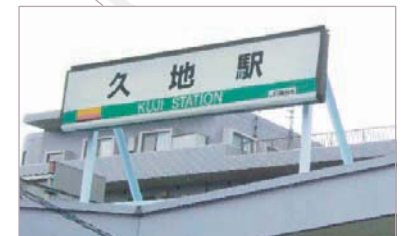
JR南武線 久地駅下車 (改札は1つです)