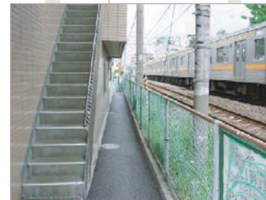
薬局横の細い私道を通ります