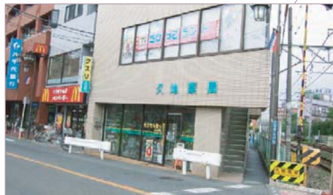
八千代銀行・マクドナルド・久地薬局

214-0021 神奈川県川崎市多摩区宿河原6-28-11 TEL : 044-850-8801 (代) FAX : 044-850-8838