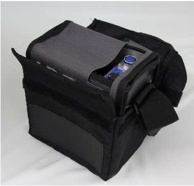
① A-E2MKL を入れる