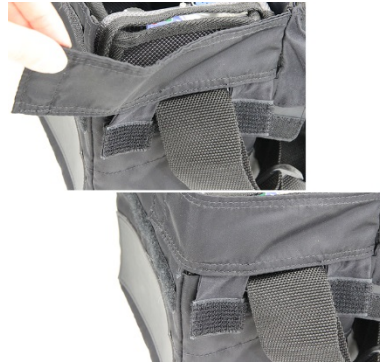
②両脇のマジックテープを止める（左右ともに）