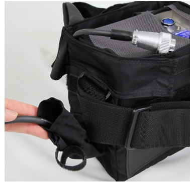
③MK-L3II のケーブルを通す