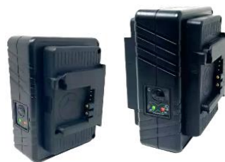
B-Mount 充電器 GPM-X2B 標準価格 45,100 円 (税込)