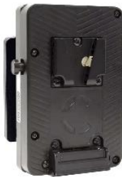
HLX-BABV-S35 標準価格 40,700 円 (税込)