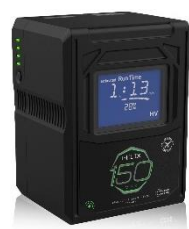
HLX-150MXS 標準価格 122,100 円 (税込)