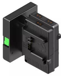
HLX-TB-SFF 標準価格 57,200 円 (税込)