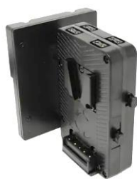
HLX-TS-SFF 標準価格 53,900 円 (税込)