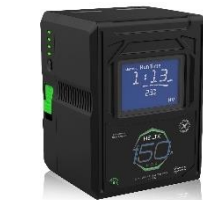
HLX-150MXB 標準価格 122,100 円 (税込)