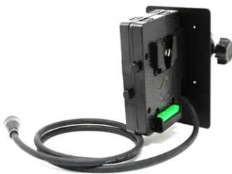
HLX-TS-CPM-3P 標準価格 64,900 円 (税込)