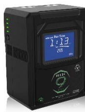
HLX-9MXS 標準価格 97,900 円 (税込)