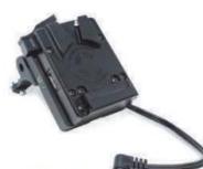
CXVM-FX6 A v-mount micro-style power option for the Sony FX6 標準価格 ¥57,200 (税込)