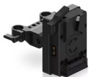
CXVM-15 標準価格 ¥35,200 (税込)