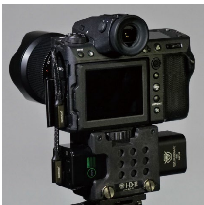
一眼カメラの外部電源として