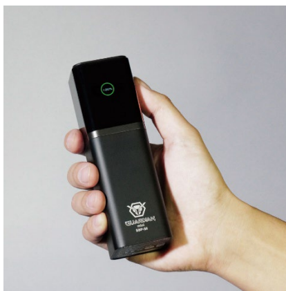
持ち運びに便利な小型タイプ