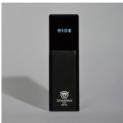
SSP-50 GUARDIAN mini