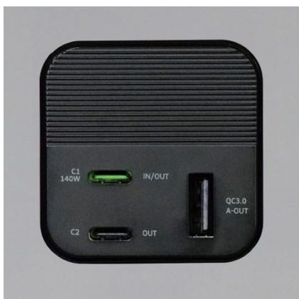
USB Type-C(USB PD) × 2, Type-A × 1