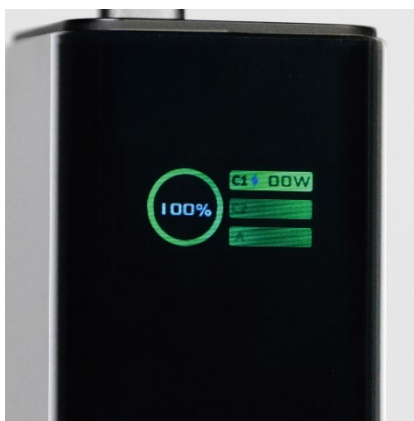
100%までわずか 19 分で充電