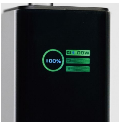
100%までわずか19分で充電