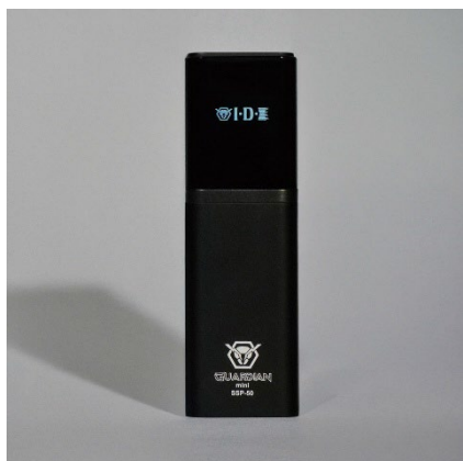
SSP-50 GUARDIAN mini

GUARDIANmini 特設ページ https://www.idx.tv/guardianmini/